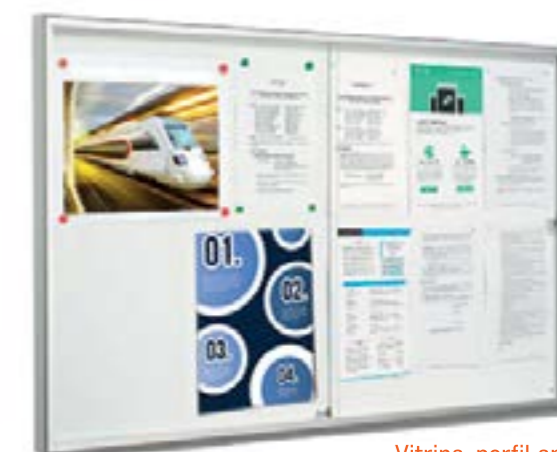
Vitrina perfil angulado con puertas correderas

Posibilidad de personalizar la vitrina con su logo.