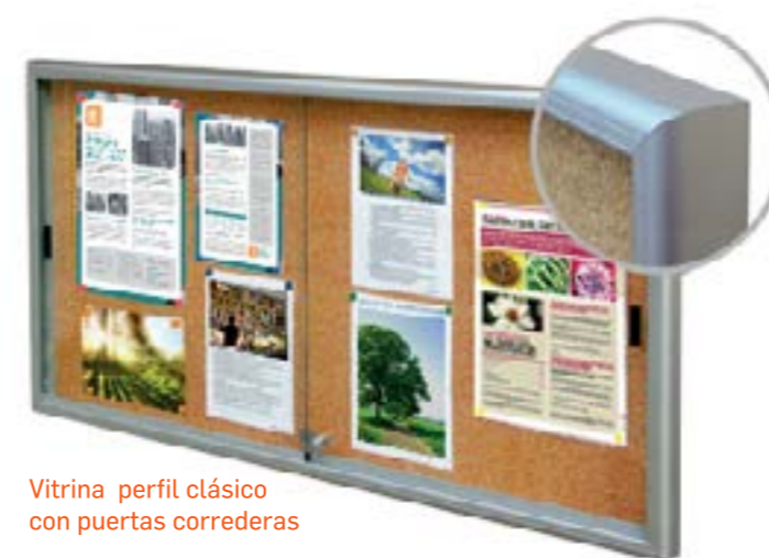
Vitrina perfil clásico con puertas correderas

Fondo chapa electrozincada, lacada en blanco y provistas de junta de estanqueidad de elastómero y orificios anticondensación.